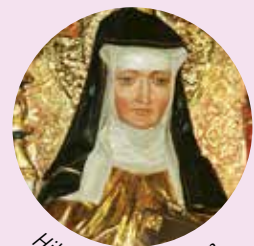
Hildegard von Bingen