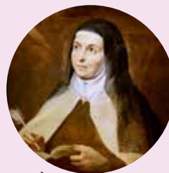
Teresa van Avila